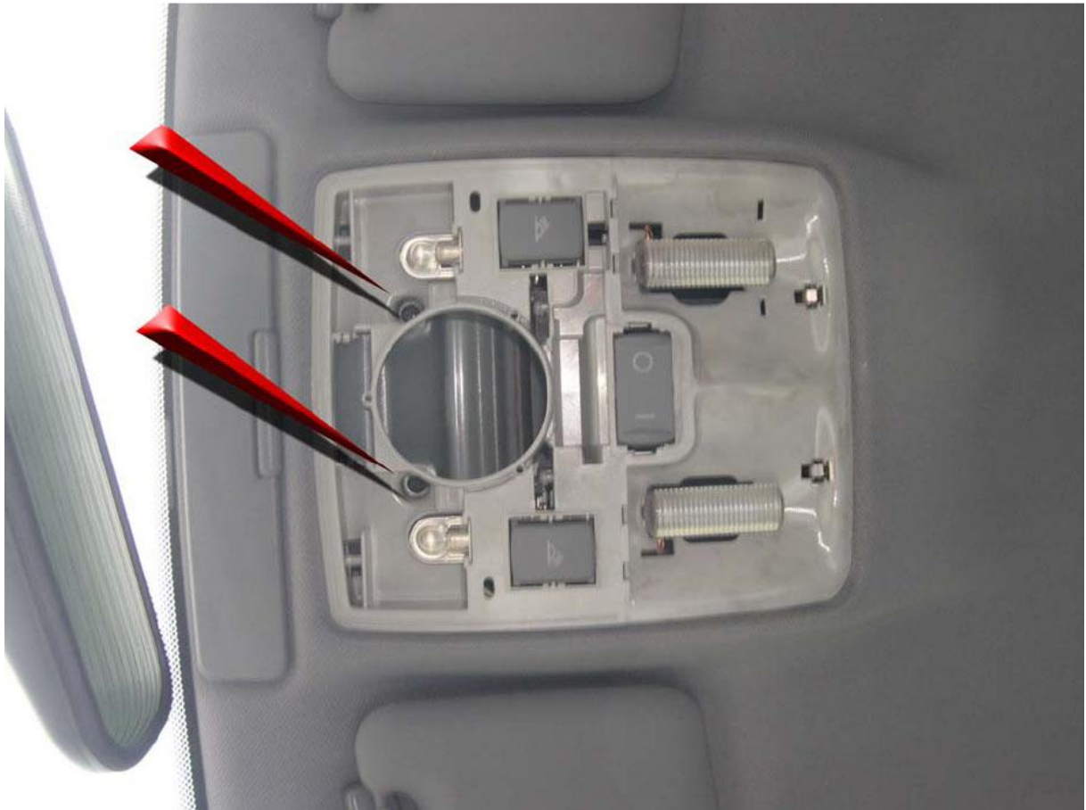
Une fois démonté, le plafonnier se declipse facilement, on enlève la fiche électrique